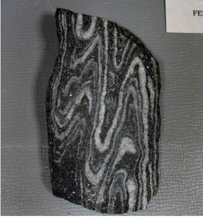
Фото. Железистый кварцит.

Ответ: Текстура руды – плейчатая. Такая текстура, в данном случае, обусловлена действием направленного давления и складчатых деформаций, действующих в процессе регионального метаморфизма.