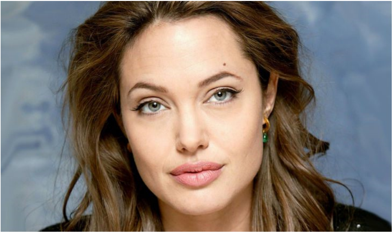
На фото: Анджелина Джоли