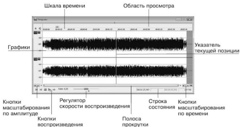
Рис. 4. Окно данных

В верхней части окна данных размещается Шкала времени , которая по умолчанию отградуирована в часах, минутах, секундах и тысячных долях секунды. Над шкалой времени находится полоса, на которой показываются значки установленных маркеров и областей, а также линия, отмечающая текущее положение, – область просмотра . В области просмотра всегда показывается весь файл, от начала и до конца, независимо от выбранного масштаба отображения графика. Большую часть окна занимают графики – изображения данных. Если открыта монофоническая (одноканальная) запись, то показывается один график; при стереофонической (двухканальной) записи графиков будет два. Верхний график изображает левый канал, нижний – правый. Расстояние от левого края графика до правого показывает длину файла.