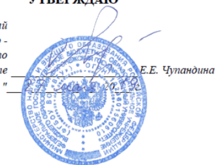
Календарный учебный график

Первый проректор - проректор по учебной работе