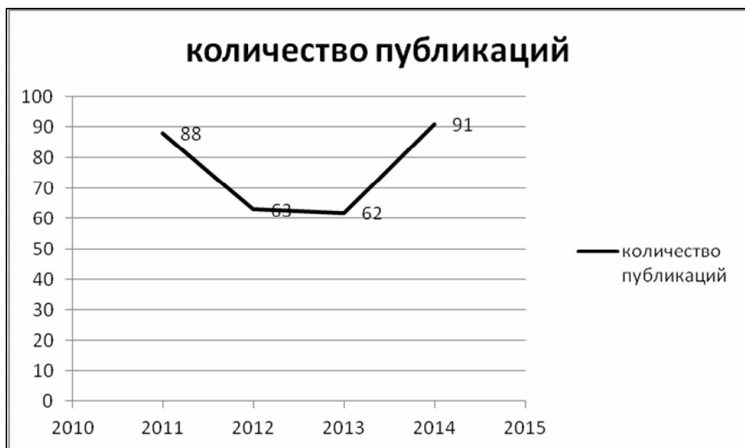
Рис. 4.2. Общее количество публикаций сотрудников кафедры экологии и земельных ресурсов за 2011-2012 гг.