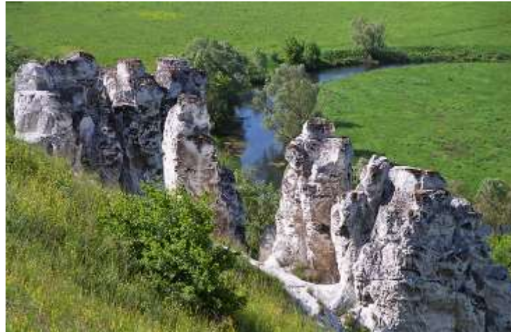
Рисунок 1 – Большие Дивы