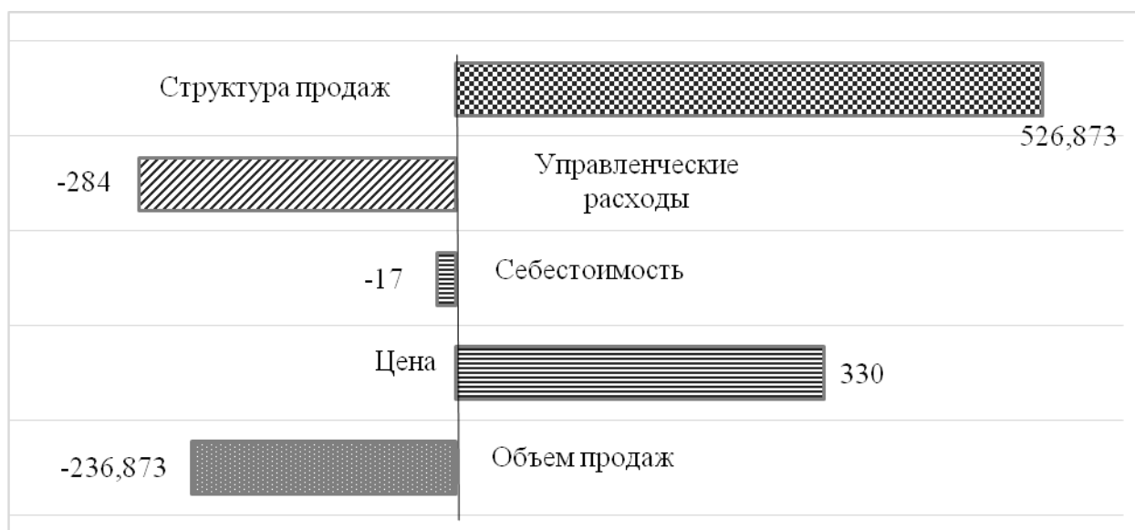
Рис. 3.3. Факторы, влияющие на прибыль от продаж