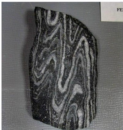
Фото 1. Железистый кварцит

ЗАДАНИЕ 1. Перед Вами фотография образца железистого кварцита (фото 1). Назовите текстуру руды и какими факторами были обусловлены такие текстурные особенности образца?