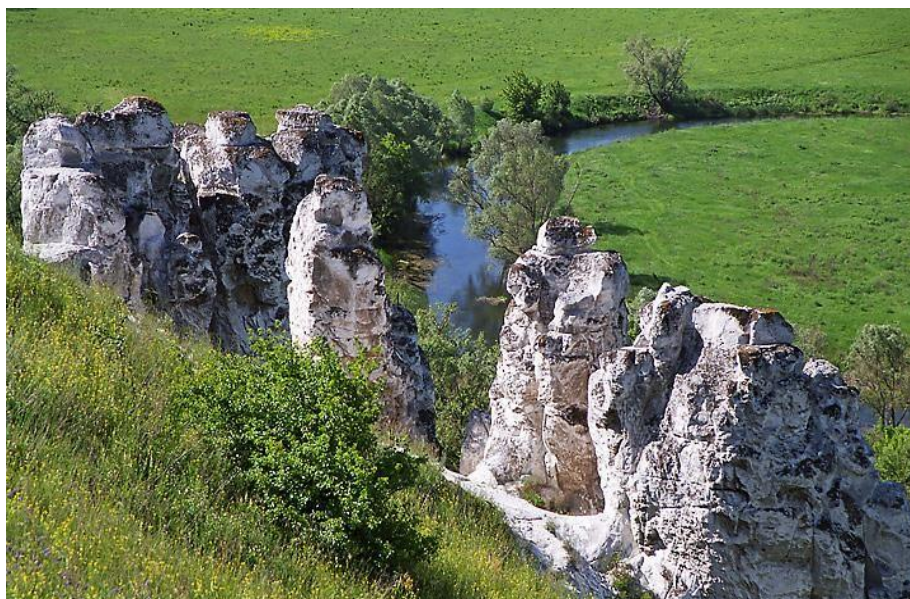
Рисунок 1 – Большие Дивы