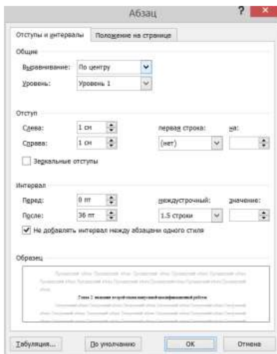
Рисунок 2 - Параметры абзаца для заголовков первого уровня

тру либо с выравнением по левой границе абзаца с абзацным отступом. Заголовки первого уровня отделяют от основного текста тремя интервалами (три интервала, но не три строки!). Смотрите рисунок 2.