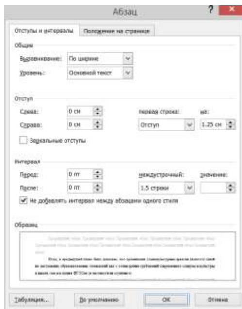
Рисунок 1 - Параметры текстовых абзацев

Все страницы, включая Список иллюстративного материала и Приложения, нумеруются по порядку без пропусков и повторений. Первой страницей считается титульный лист, на котором нумерация страниц не ставится , на следующей странице ставится цифра «2» и так далее. Порядковый номер страницы печатают на середине верхнего поля страницы (верхний колонтитул).